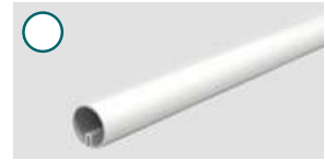
Aluminium, weiß ■ 1500 mm, Ø 40 mm