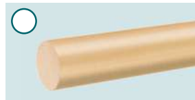
Ahorn, lackiert ■ 2000 mm, Ø 40 mm