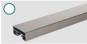
Aluminium ■ 2000x60x25 mm

Aluminium = stabil, günstig und witterungsbeständig