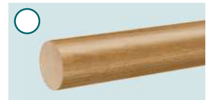
Eiche, lackiert ■ 2000 mm, Ø 40 mm