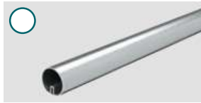
Aluminium ■ 1500 mm, Ø 40 mm