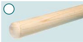
Fichte, roh ■ 1500 mm/2250 mm, Ø 52 mm