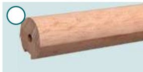
Buche, roh ■ 1500 mm/2250 mm, Ø 52 mm