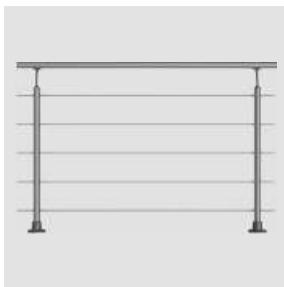
Geländer-Komplettsset Aluminium, 1,5 m, 5 Edelstahlstäbe