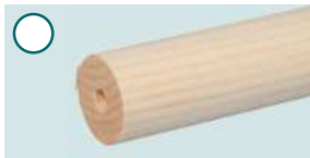
Fichte, roh ■ 1500 mm/2250 mm, Ø 40 mm