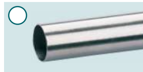
Edelstahl, V2A ■ 1500 mm/2000 mm, Ø 40 mm