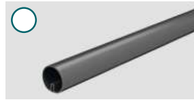
Aluminium, anthrazit ■ 1500 mm, Ø 40 mm