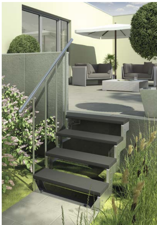
Escalier droit élégant avec éléments latéraux en acier et différents matériaux de marches