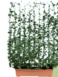
'Hecke am laufenden Meter® Balkon'