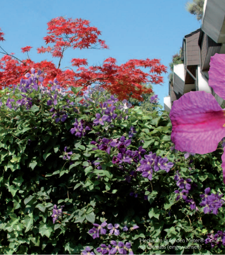
'Hecke am laufenden Meter® Color mit Clematis (eingewachsen)