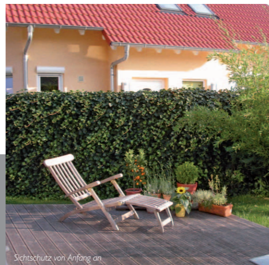
Sichtschutz von Anfang an

Mit der 'Hecke am laufenden Meter®' lassen sich im Handumdrehen Gartenräume schaffen, in denen Sie Ruhe und Entspannung finden. Sie bietet Schutz vor akustischen Belästigungen, filtert Staub und Schadstoffe und gibt nützlichen Kleintieren Lebensraum.