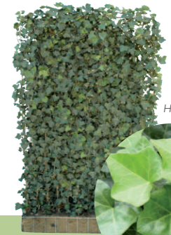
Heder helix 'Woerner'