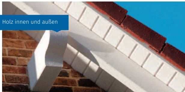
Holz innen und außen