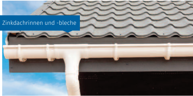
Zinkdachrinnen und -bleche