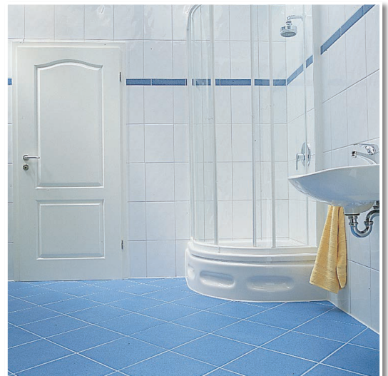
Die fertige Dusche. Eck- und Anschlussfugen elastisch abgedichtet.